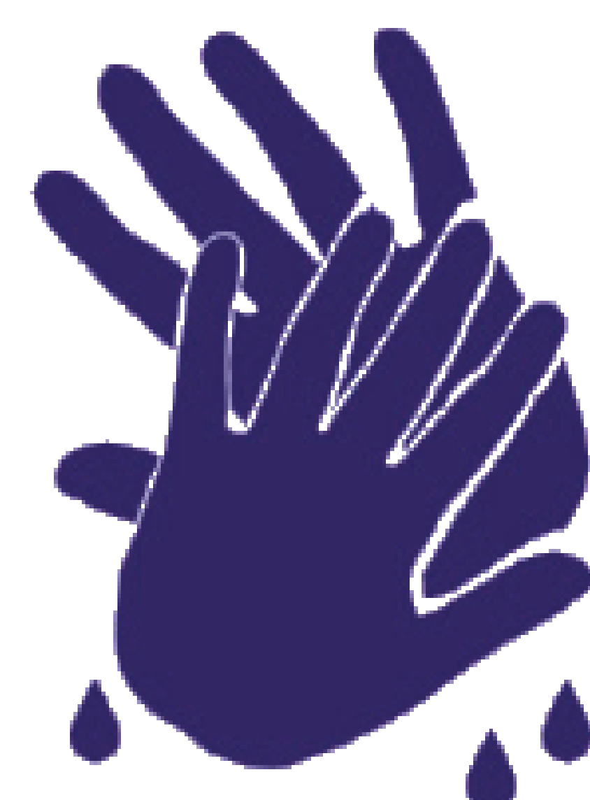
spoelen en drogen met wegwerppapier