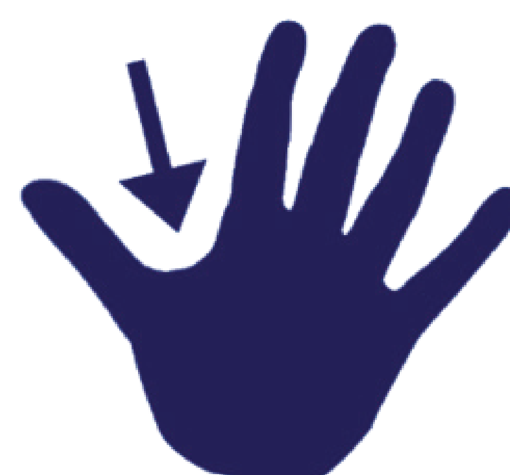
tussen duim en wijsvinger