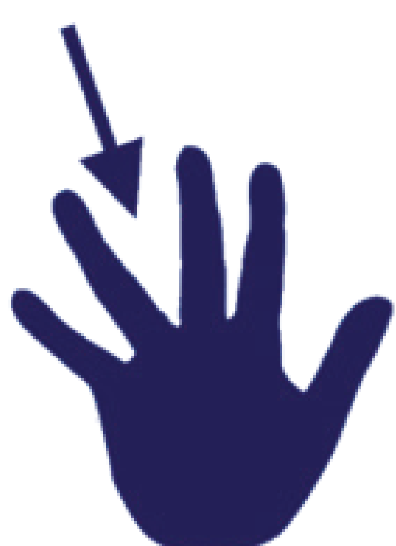
tussen de vingers