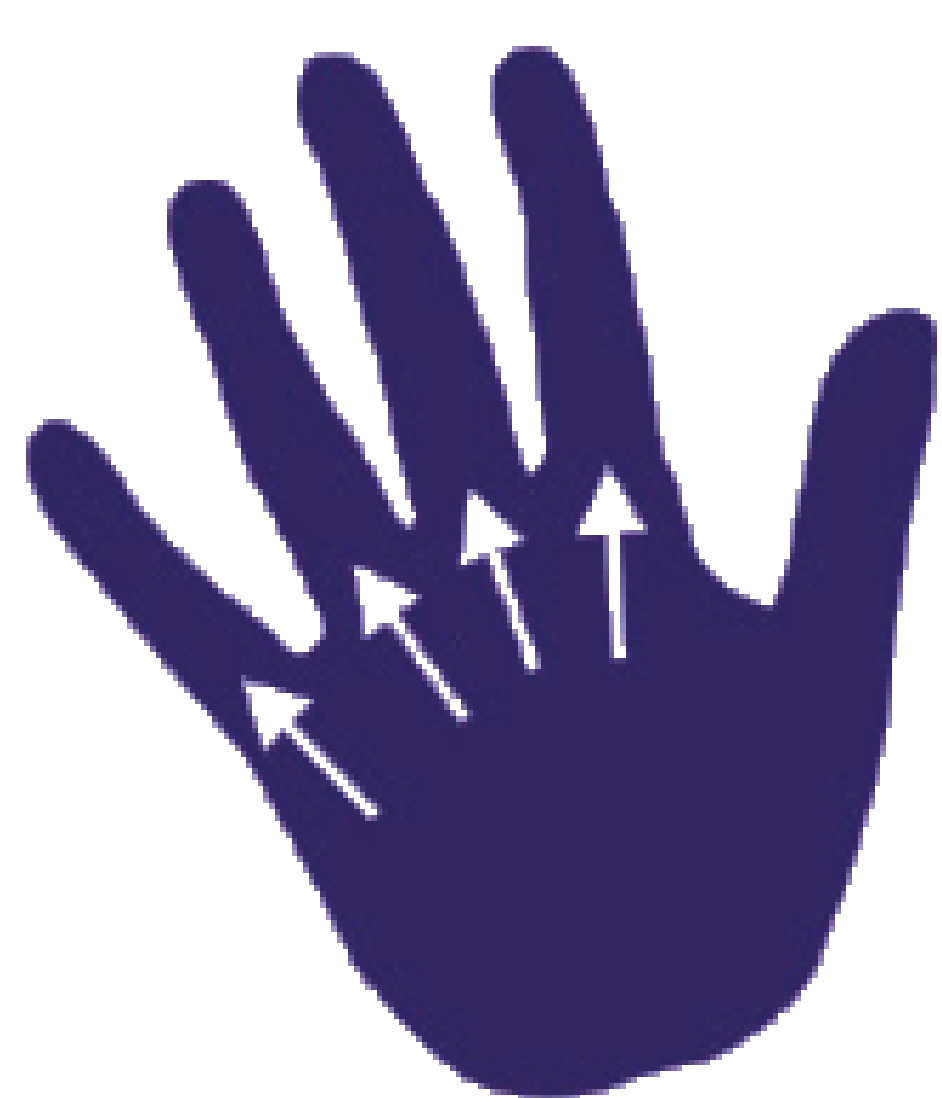
de basis van je vingers